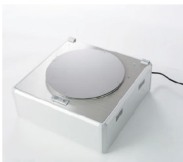
ロゴストロンタキオンアンパイア